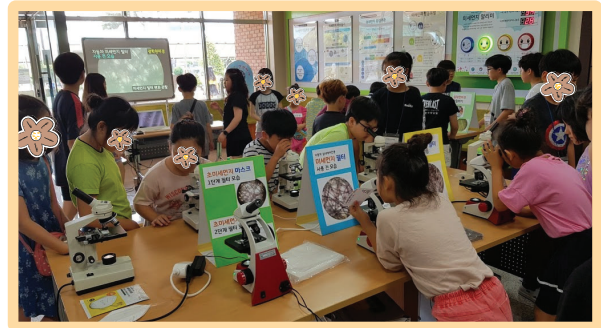
미세 먼지 필터 관찰 체험 부스를 설치하여 학생들이 체험하고 있다.